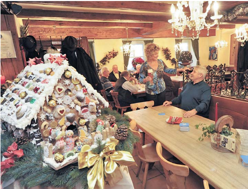
Gute Stube: Im Truderinger Gasthof Obermaier wird bayerische Küche der engagierten Art gepflegt. Die Portionen sind üppig – und die Gerichte äußerst schmackhaft.